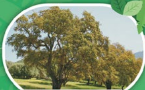
QUERCIA DA SUGHERO

RAGGIUNGE DIMENSIONI NOTEVOLI, È LONGEVA E RESISTENTE. PUÒ VIVERE ANCHE 300 ANNI.